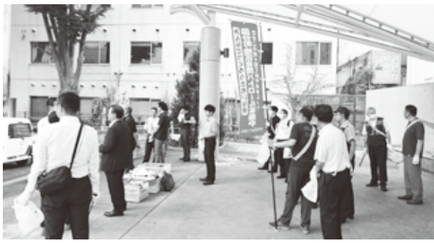
パトロール出発の様子