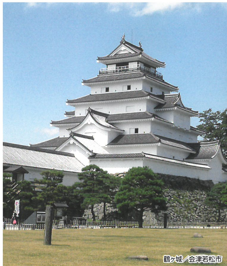
鶴ヶ城 / 会津若松市