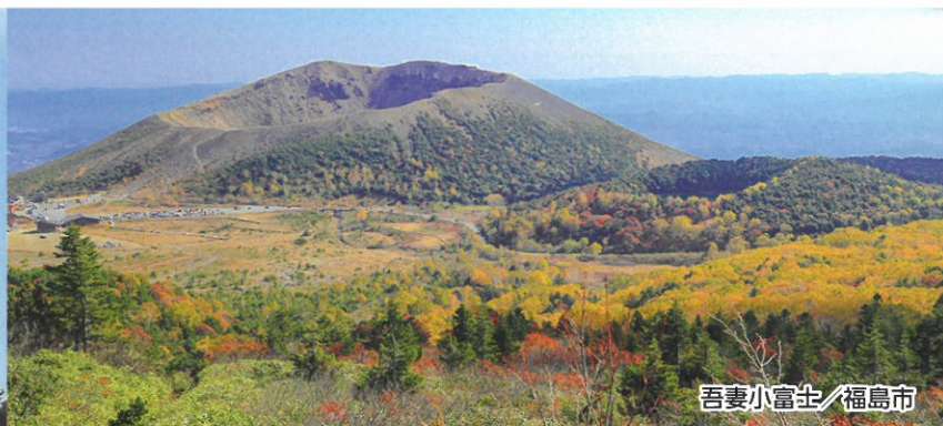
吾妻小富士 / 福島市