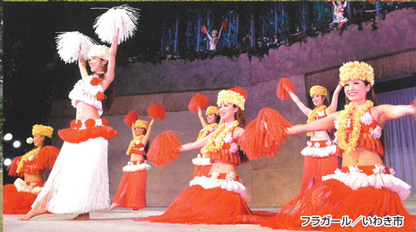
フラガール / いわき市